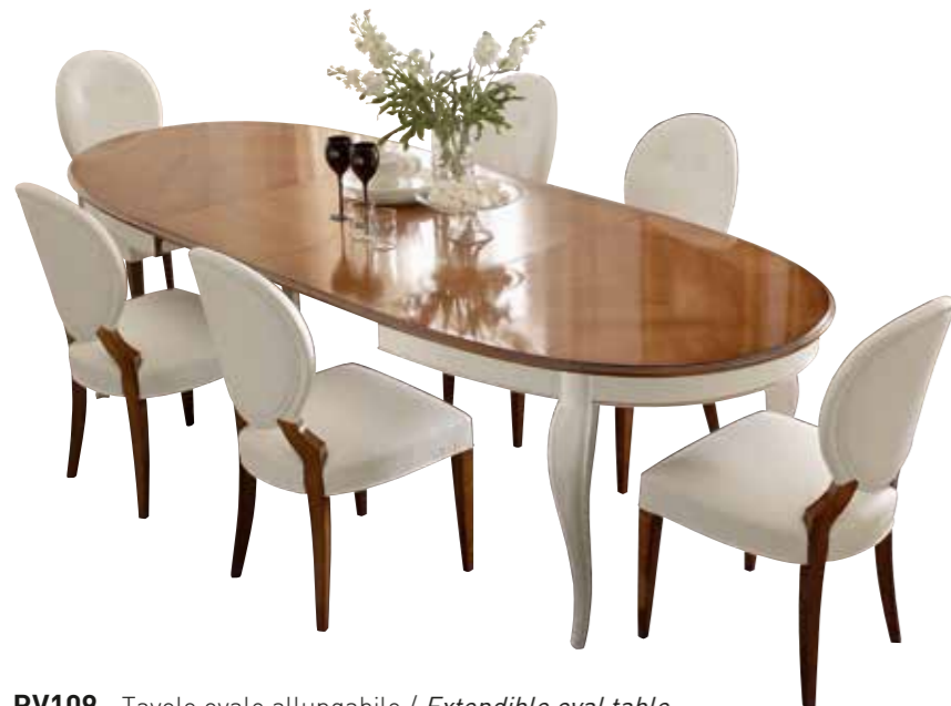
RV109 Tavolo ovale allungabile / Extendible oval table L. 180 (280) H. 80 P. 110 finitura / finish: BIANCO RIVA - CILIEGIO PAG. 34