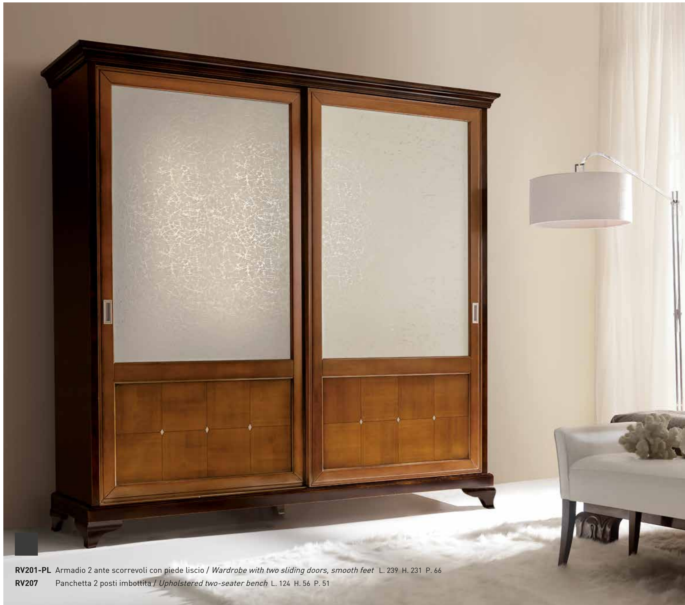
RV201-PL Armadio 2 ante scorrevoli con piede liscio / Wardrobe with two sliding doors, smooth feet L. 239 H. 231 P. 66