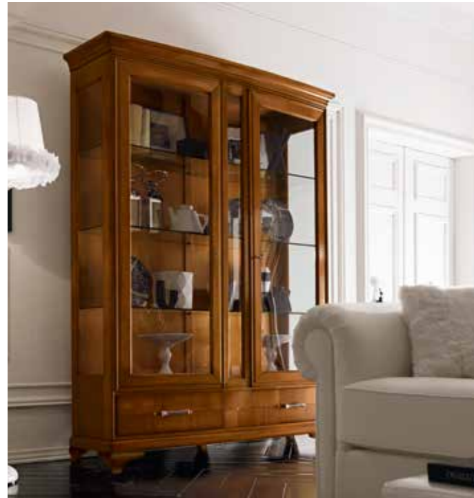
RV105-PL Vetrina 2 ante con piede liscio Two-door display cabinet with smooth feet L. 162 H. 215 P. 52 finitura / finishes: CILIEGIO PAG. 62