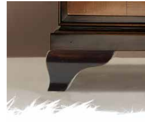
Piede liscio / Smooth feet