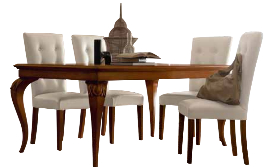
RV107 Tavolo rettangolare allungabile / Extendible rectangular table L. 180 (240) H. 79 P. 100 - finitura / finish: CILIEGIO PAG. 56