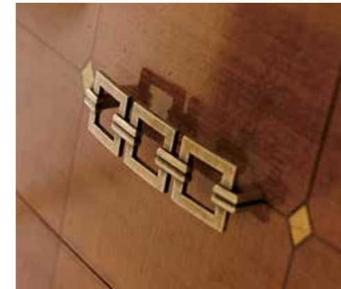
Maniglia Quadro / Quadro handle Oro valenza