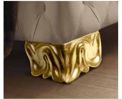
Piede intagliato / Carved feet