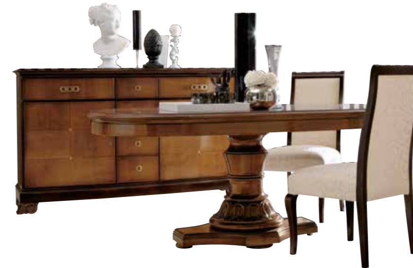
RV108 Tavolo ovale allungabile con basamento Extendible oval table with base L. 180 (230) H. 79 P. 100 finitura / finish: CILIEGIO PAG. 6