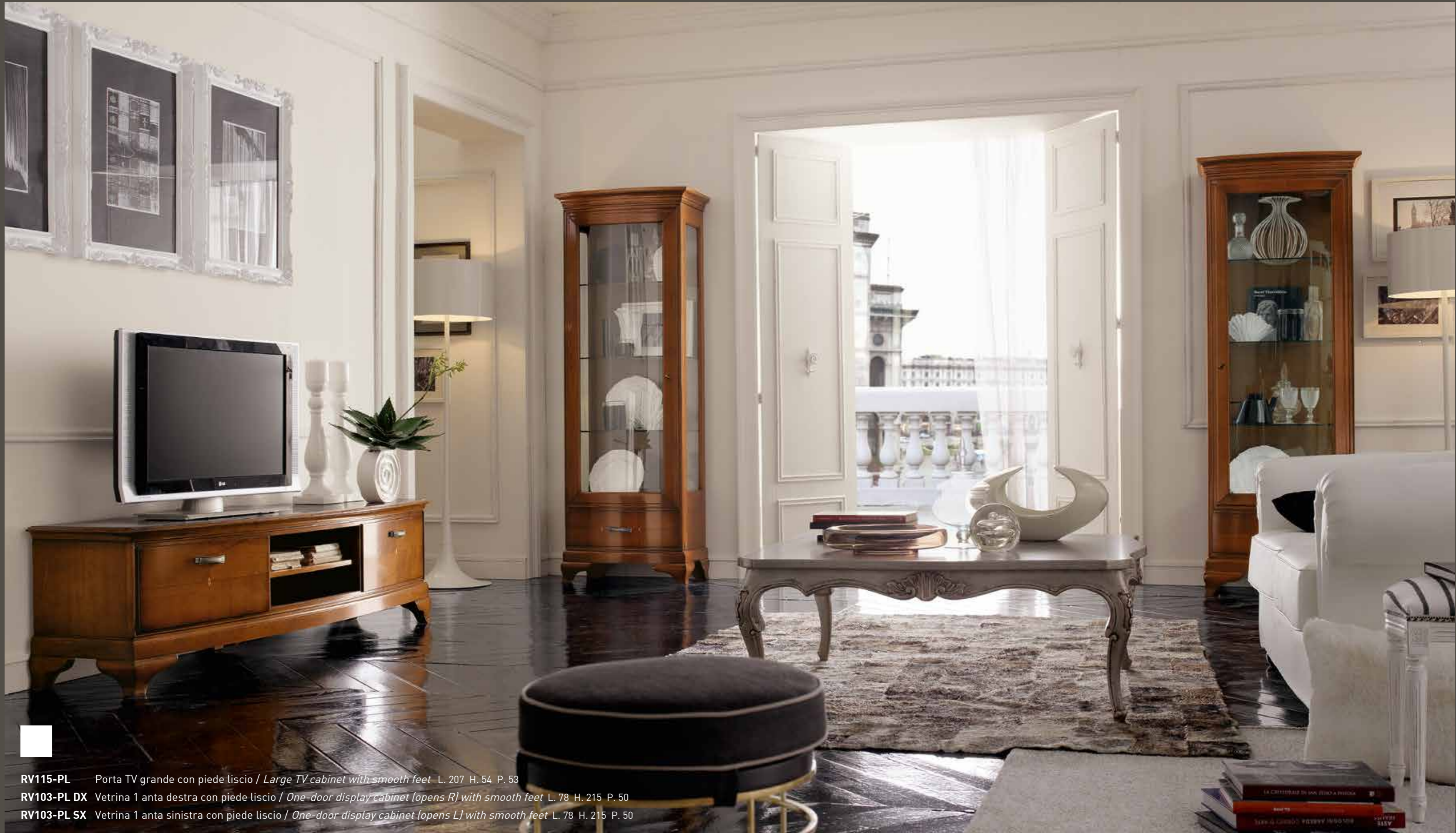
RV115-PL Porta TV grande con piede liscio / Large TV cabinet with smooth feet L. 207 H. 54 P. 53