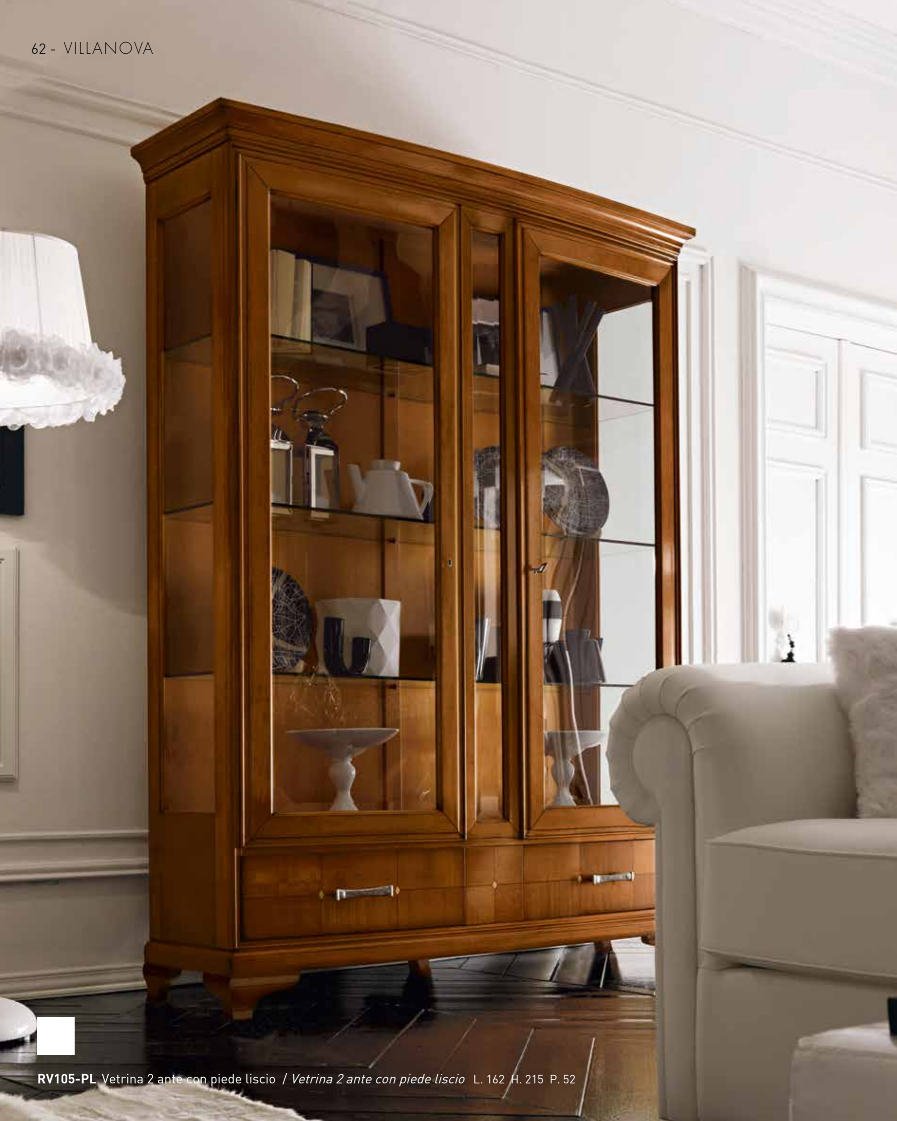
RV105-PL Vetrina 2 ante con piede liscio / Vetrina 2 ante con piede liscio L. 162 H. 215 P. 52