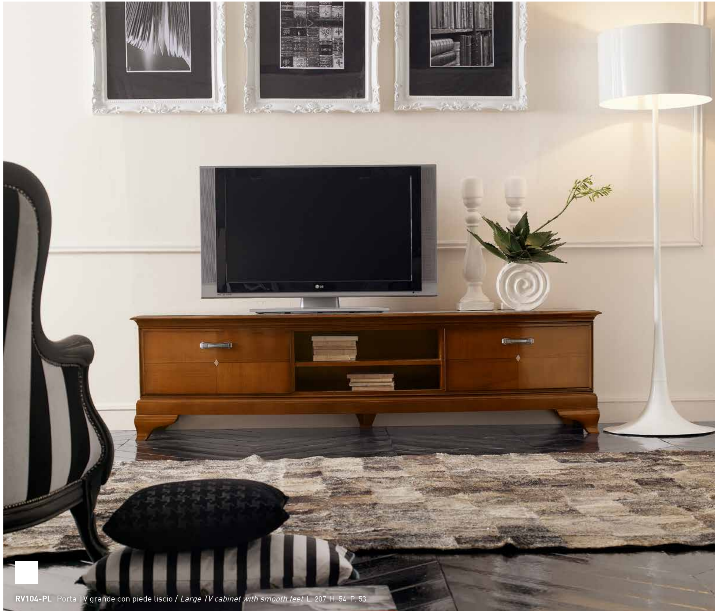
RV104-PL Porta TV grande con piede liscio / Large TV cabinet with smooth feet L. 207 H. 54 P. 53