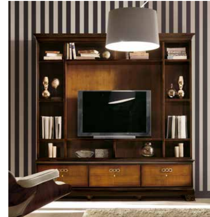
RV115 Alzata mobile soggiorno / Wall system top unit L. 209 H. 162 P. 40 finitura / finishes: MOKA FRANCESE - CILIEGIO PAG. 14