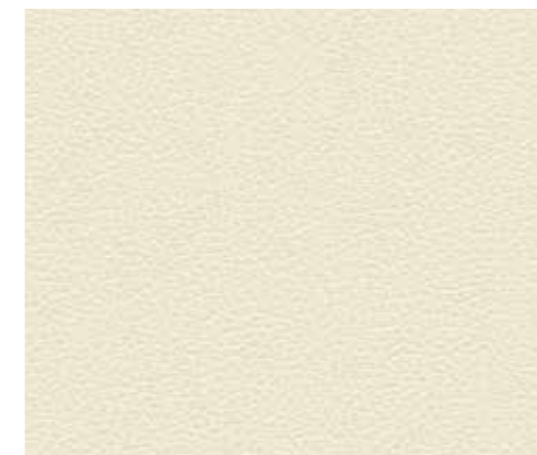
195 Pelle / Leather LATTE

Su richiesta è possibile avere la variante in ecopelle Faux leather is available upon request