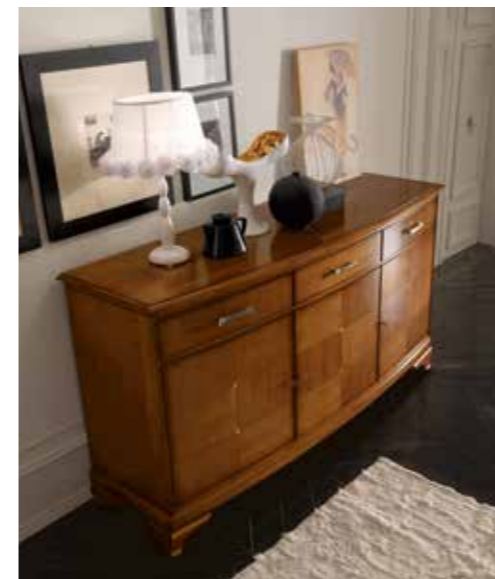
RV101-PL Credenza 3 ante e 3 cassetti con piede liscio Three-door sideboard with 3 drawers, smooth feet L. 207 H. 107 P. 63 finitura / finish: CILIEGIO PAG. 56