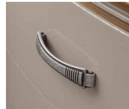
Maniglia Slim old / Slim old handle Argento vecchio