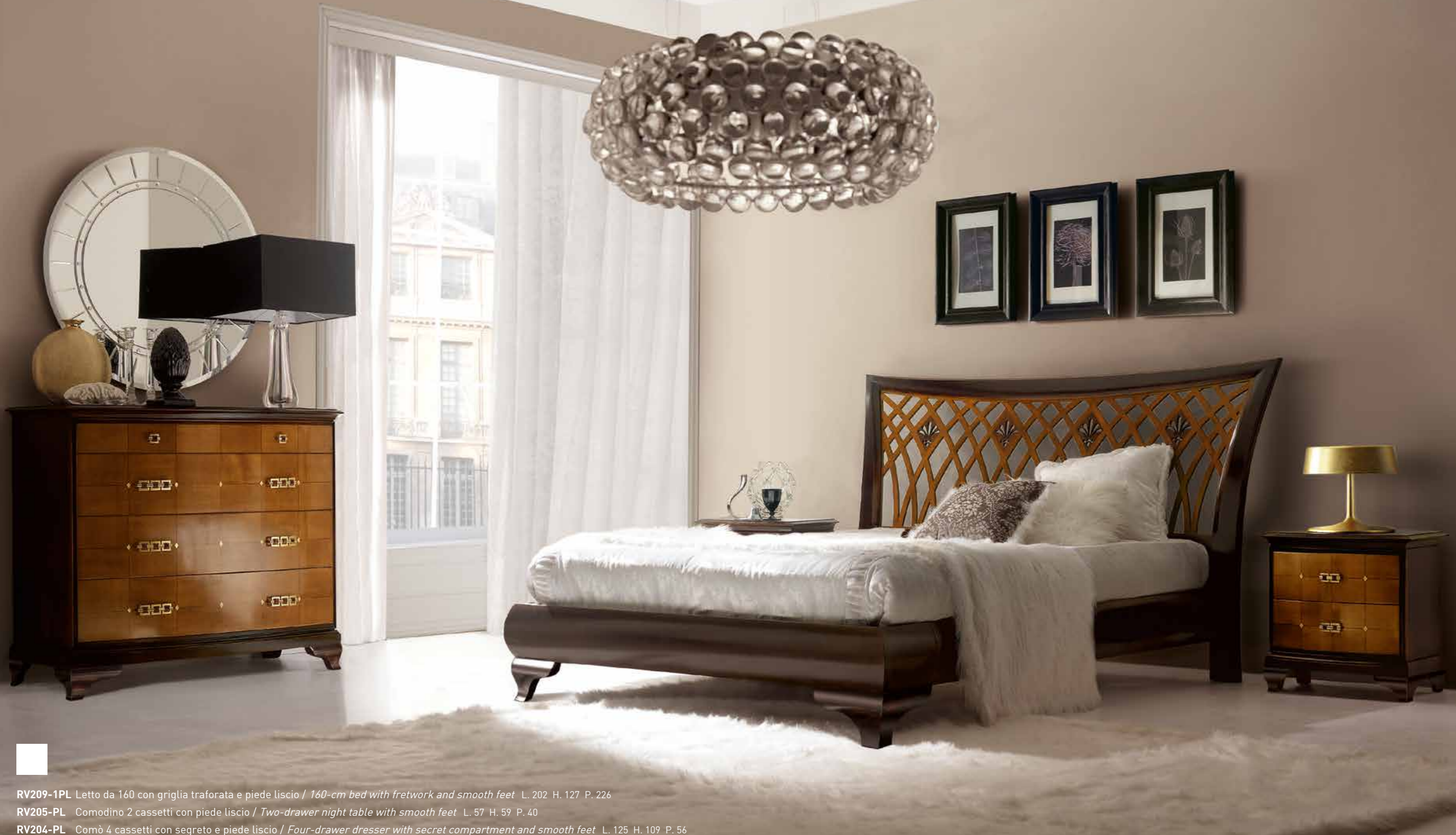
RV209-1PL Letto da 160 con griglia traforata e piede liscio / 160-cm bed with fretwork and smooth feet L. 202 H. 127 P. 226