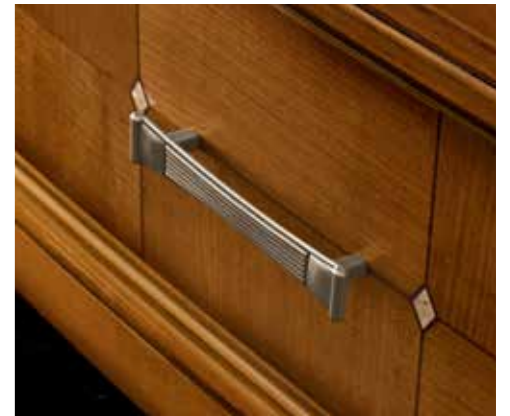
Maniglia Slim / Slim handle Nickel satinato