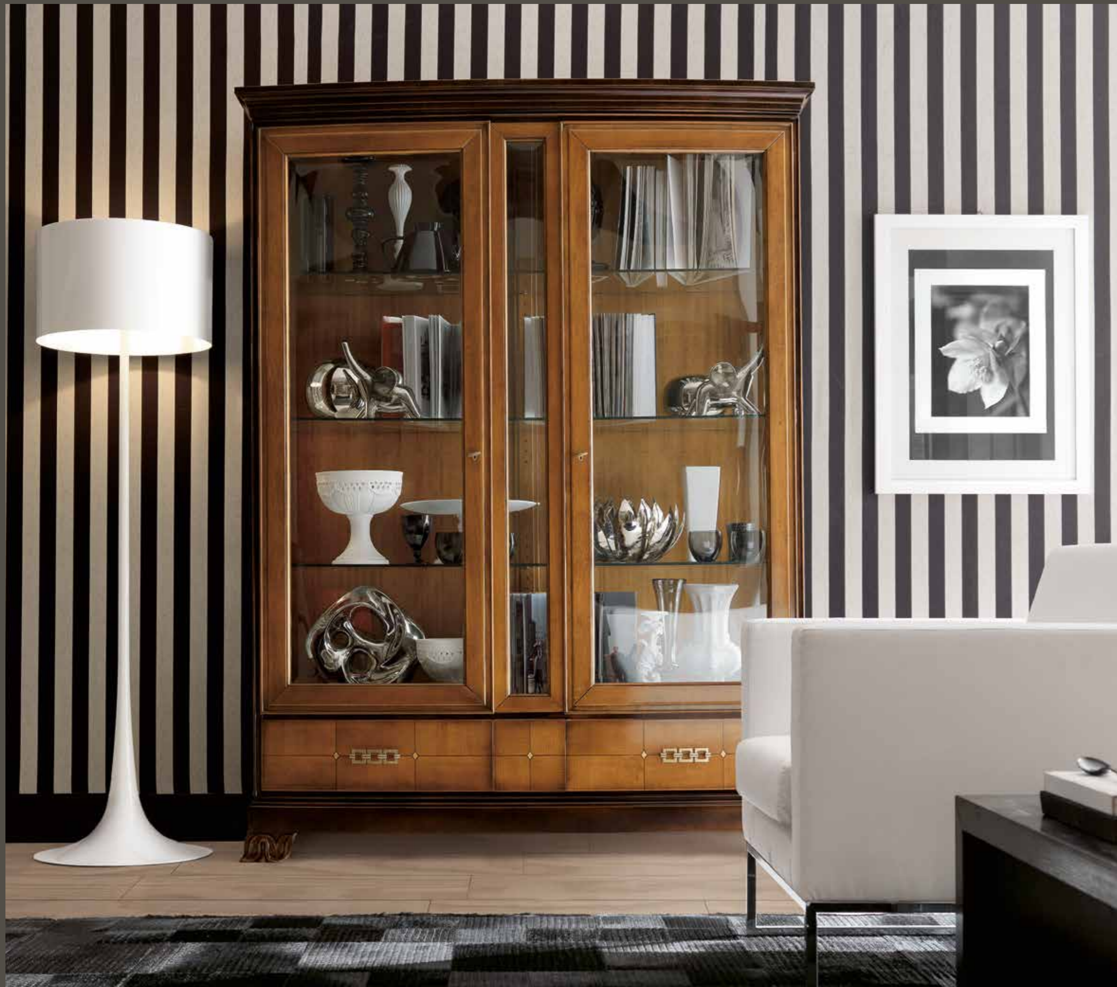
RV105-PI Vetrina 2 ante con piede intagliato Two-door display cabinet with carved feet L. 162 H. 215 P. 52

Cristallo e legno tracciano le linee base di questa vetrina a due ante, con inserto centrale fisso in cristallo. La schiena in essenza può essere rivestita con stoffe seriche, che conferiscono al mobile tratti eleganti.