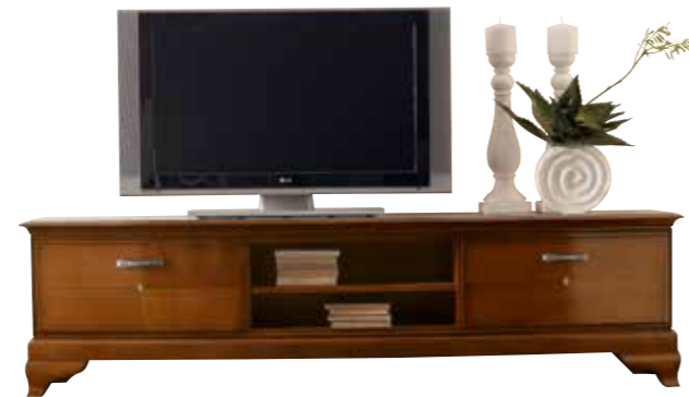
RV104-PI Porta TV grande con piede intagliato Large TV cabinet with carved feet L. 207 H. 54 P. 53