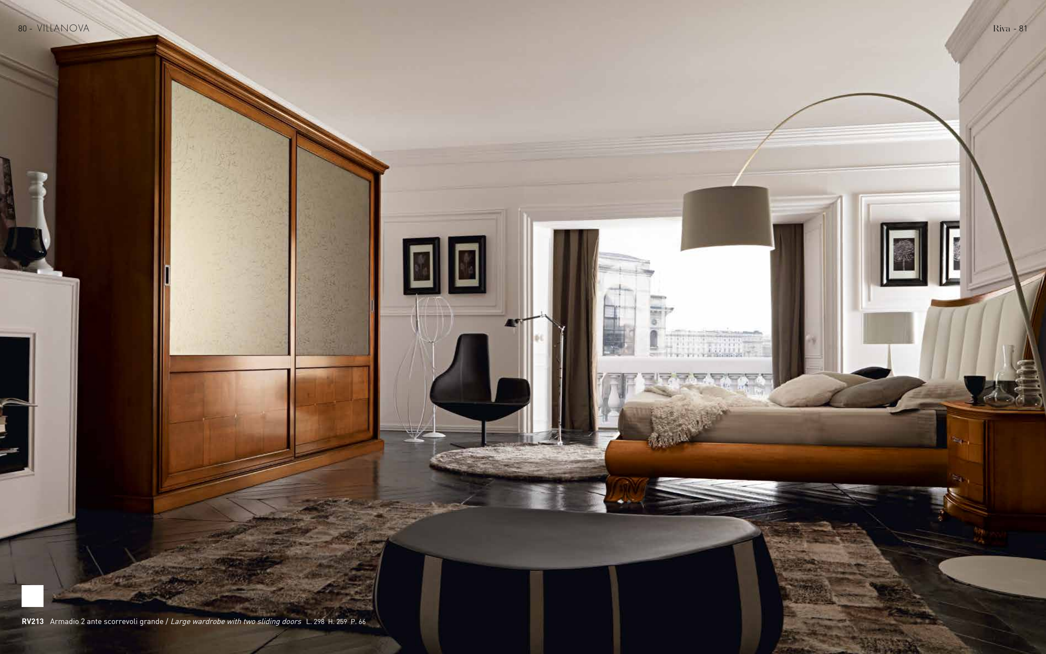
RV213 Armadio 2 ante scorrevoli grande / Large wardrobe with two sliding doors L. 298 H. 259 P. 66